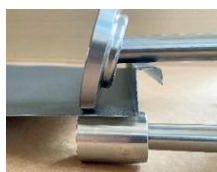
Profilhöjd 28 mm.

DET SKA VARA LÄTT ATT VARA PROFESSIONELL